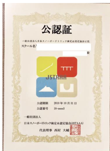
※①校認証デザイン(例)