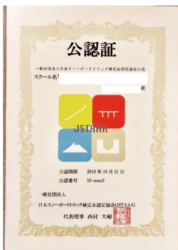
※①校認証デザイン(例)